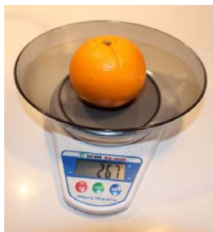
Obr. 1 Váženie pomaranča