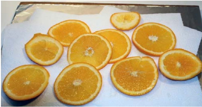
Obr. 2 Pomaranč nakrájaný na plátky ((foto Bossiová, L., 2011)

V texte sa číslo a názov tabuľky umiestňuje nad tabuľku.